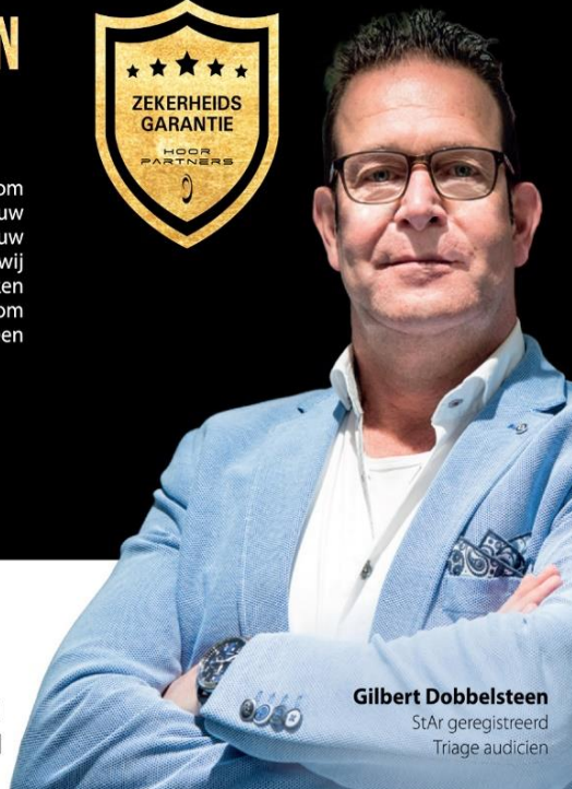
Gilbert Dobbelsesteen StAr geregistreerd Triage audicien